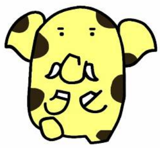
新座市イメージキャラクター 「ゾウキリン」